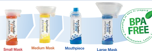
Small Mask Medium Mask Mouthpiece Large Mask

© 2013 Monaghan Medical Corporation™ and ® are trademarks and registered trademarks of Monaghan Medical Corporation or an affiliate of Monaghan Medical Corporation. This device was Made in the USA from US and Canadian parts.