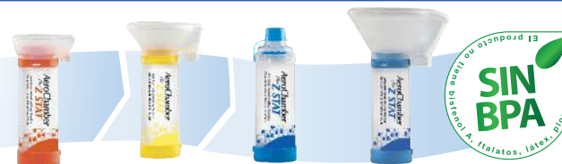
Máscara Pequeña Máscara Mediana Boquilla Máscara Grande

© 2013 Monaghan Medical Corporation.™ y ® son marcas comerciales y marcas comerciales registradas de Monaghan Medical Corporation o de una empresa afiliada de Monaghan Medical Corporation. Este dispositivo fue fabricado en EE.UU. con piezas estadounidenses y canadienses.