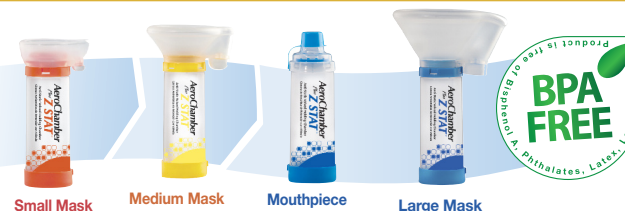
Small Mask Medium Mask Mouthpiece Large Mask

© 2013 Monaghan Medical Corporation™ and ® are trademarks and registered trademarks of Monaghan Medical Corporation or an affiliate of Monaghan Medical Corporation. This device was Made in the USA from Canadian and US parts.