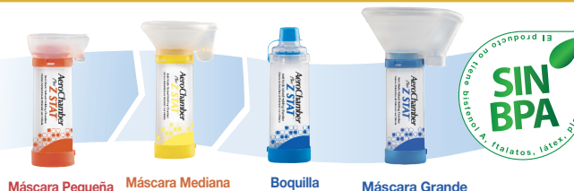
Máscara Pequeña Máscara Mediana Boquilla Máscara Grande

© 2013 Monaghan Medical Corporation. ™ y ® son marcas comerciales y marcas comerciales registradas de Monaghan Medical Corporation o de una empresa afiliada de Monaghan Medical Corporation. Este dispositivo fue fabricado en EE.UU. con piezas canadienses y estadounidenses.